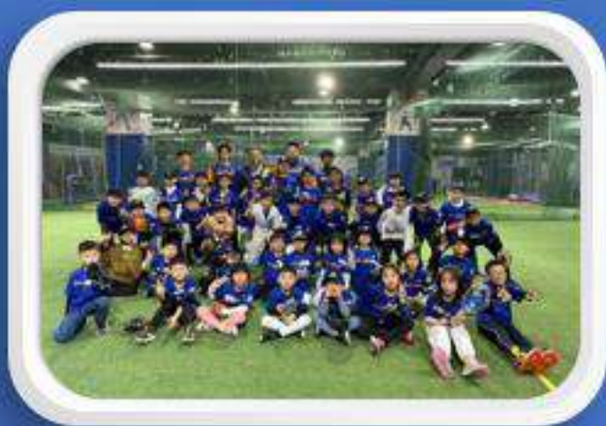
歡樂&技術 冬/夏令營 2022-2024.寒暑假