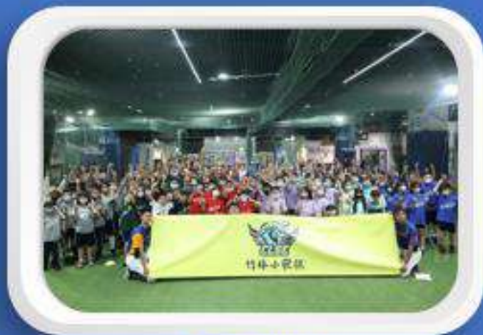
竹林小學 暑期校外活動 2023.07