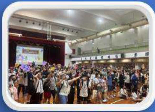
竹林中學 綜合運動團隊挑戰營 2024.05