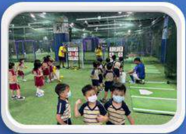
康橋幼兒園-小小運動會 2024.08