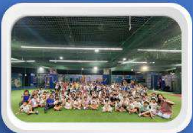
凱斯美語營隊活動 2024.08