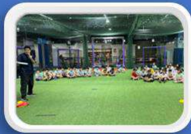
何嘉仁菁英美語 暑期活動 2024.08