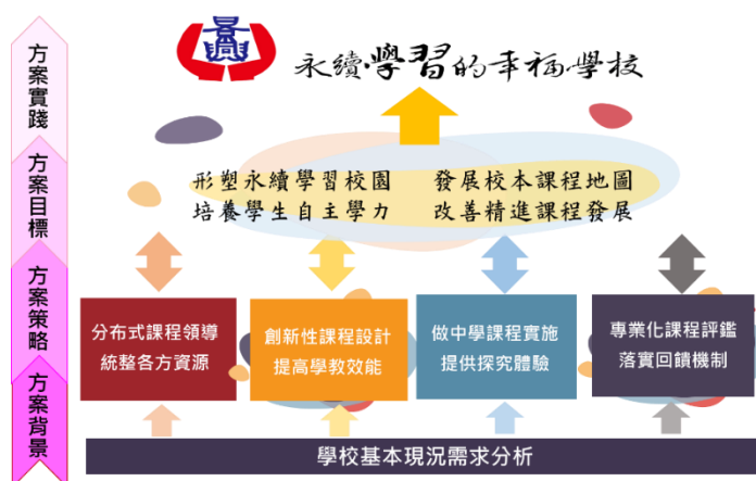
圖2 景興國中「百卉含英 景象萬興」課程發展方案架構圖

課程發展實踐過程中，課程核心小組依據校本指標，盤點部定課程及彈性學習課程，以彈性學習課程輔助部定課程學習，並透過課程評鑑針對課程進行滾動式調整，以確認課程具體目標達成；為符應學生學習需求，銜接社區學生學習經驗，113學年度起辦理分散式資優班，資優課程皆以 Renzulli(1977)博士所提出之「三合充實模式」為核心，輔以本校行之有年的 STEAM 教育之課程理念進行課程設計，聚焦於真實生活情境之問題，協以縝密的設計讓學生能夠運用數學思維進行大量科學探究。課程架構為全時抽離之核心課程（數學、理化）以水平加廣、垂直加深之課程方式進行，另依據學生個別化需求開設外加特殊需求課程，包括獨立研究與情意輔導；致力培養學生成為「懷抱溫暖前進、帶著理想飛翔的幸福創造者」，更進一步實踐「永續學習的幸福學校」之學校願景。