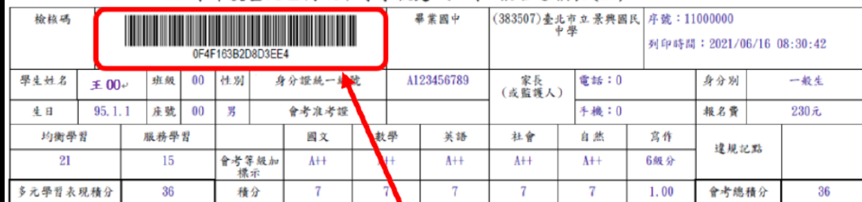
110學年度基北區高級中等學校免試入學 報名志願表(A0)