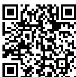
教務學務師培系統