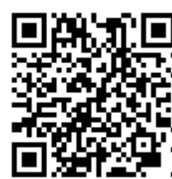
北教大學術單位聯繫方式