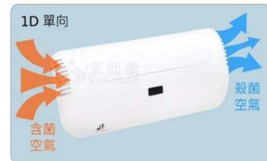
當防護罩關閉時紫外線殺菌燈內部風扇引起單向對流氣流，適合有人的環境下使用 (紫外線容易引起眼部病變，不可直視)。