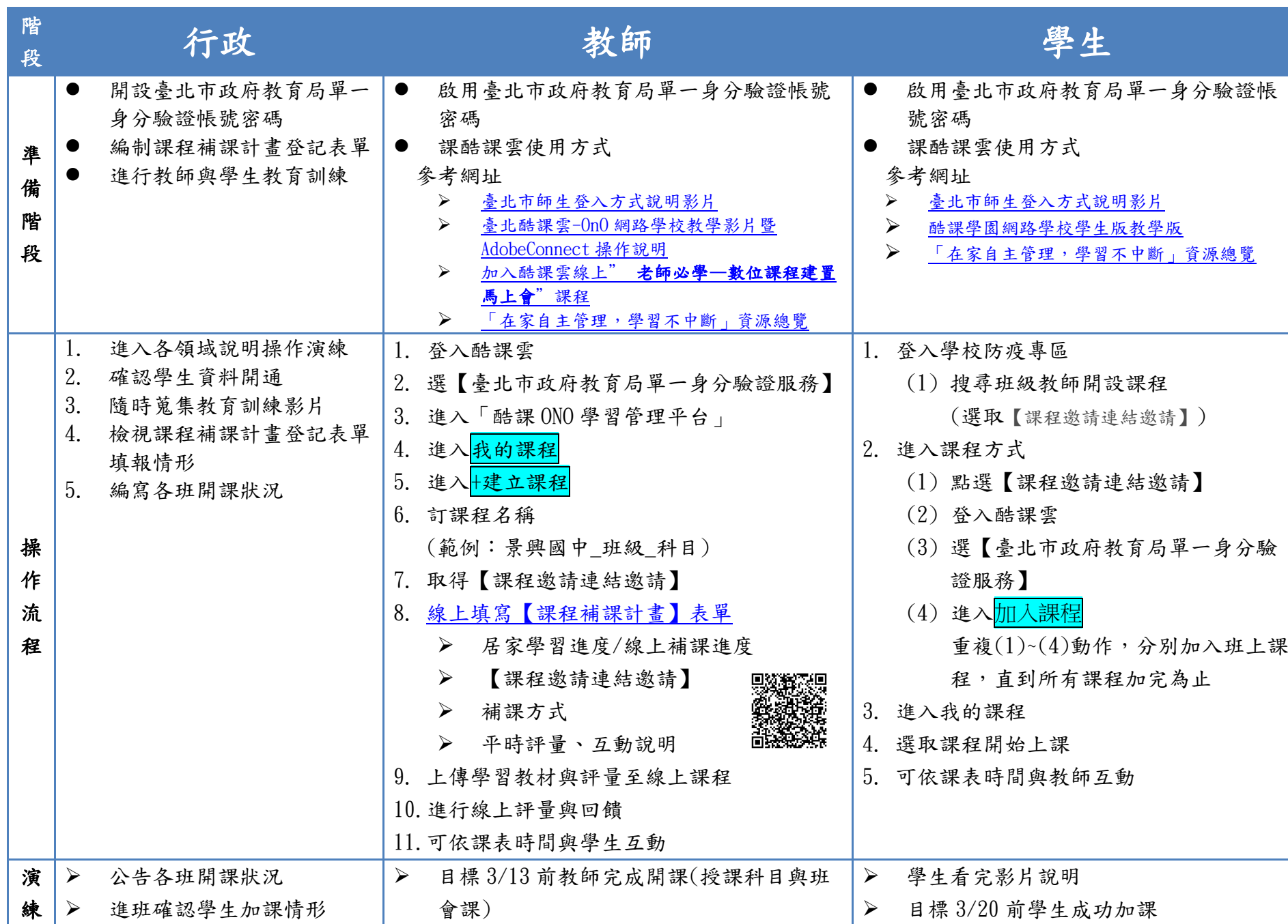
臺北市景興國中因應嚴重特殊傳染性肺炎辦理停課、復課及補課超前部屬準備措施