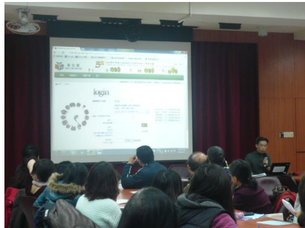
志願選填家長說明會