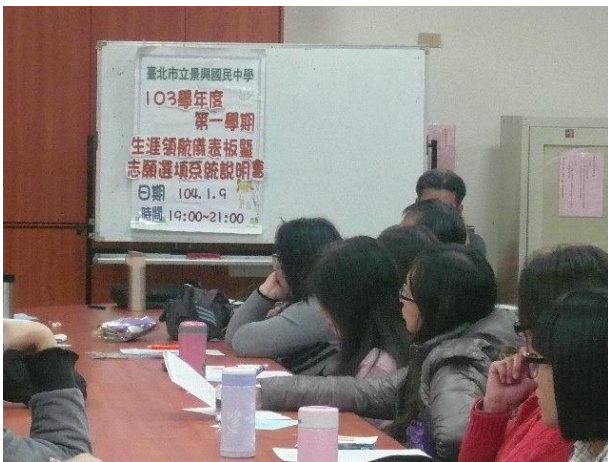
志願選填家長說明會