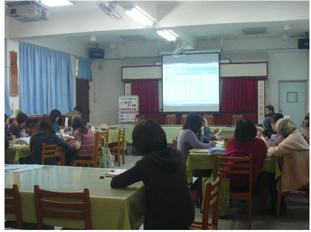
志願選填導師說明會