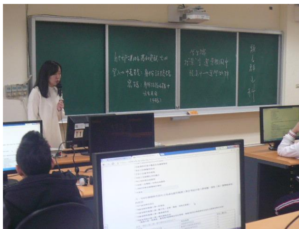
老師說明選填步驟