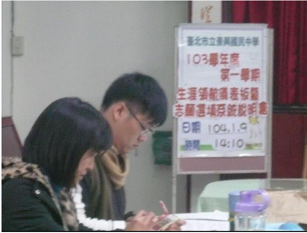
志願選填導師說明會