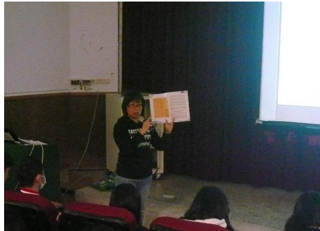
資料組長說明手冊資訊