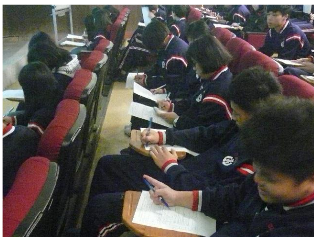
學生紀錄需注意事項