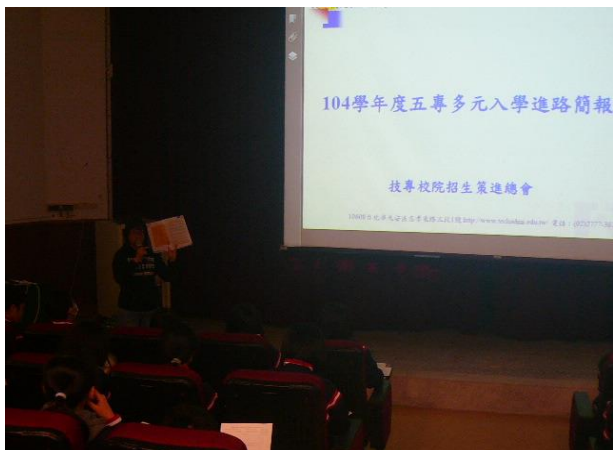
五專入學說明宣導