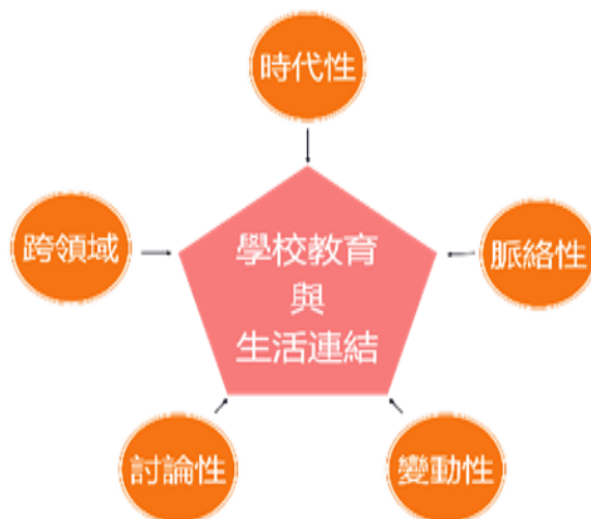
圖 1.1.1 議題的特性