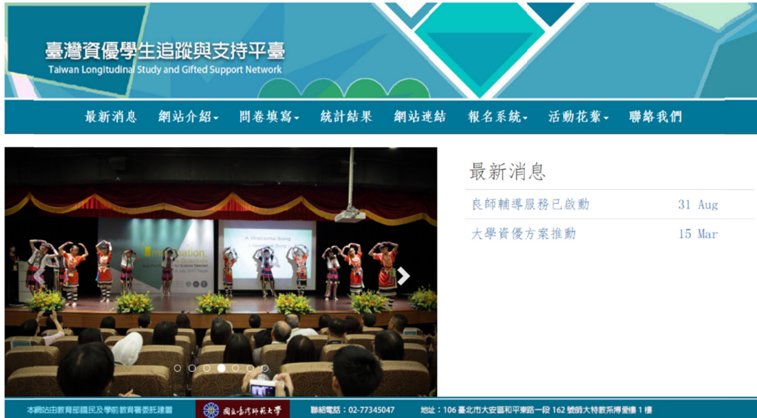
圖 1 臺灣資優學生追蹤與支持平臺