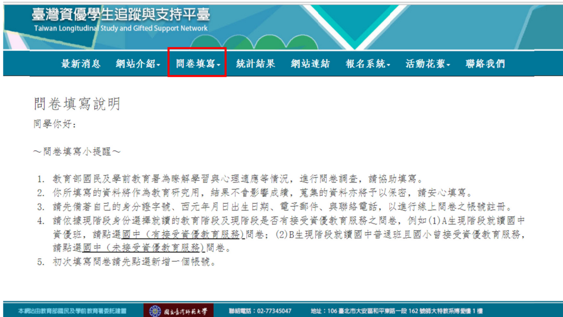
圖 2 問卷填寫