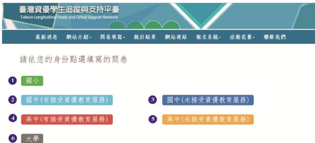
圖 10 問卷類別

請依您的身份點選填寫的問卷 ，請學生依據現階段就讀的教育階段及是否有接受資優教育服務選擇填寫之問卷，例如：A 生現階段就讀國中普通班，國小曾曾經接受資優教育服務，請點選③國中（未接受資優教育服務），另外 B 生現階段為國中資優生，請點選②國中（有接受資優教育服務）。