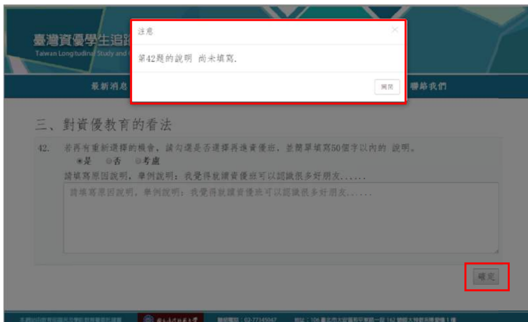
圖 19 簡答題未填寫說明