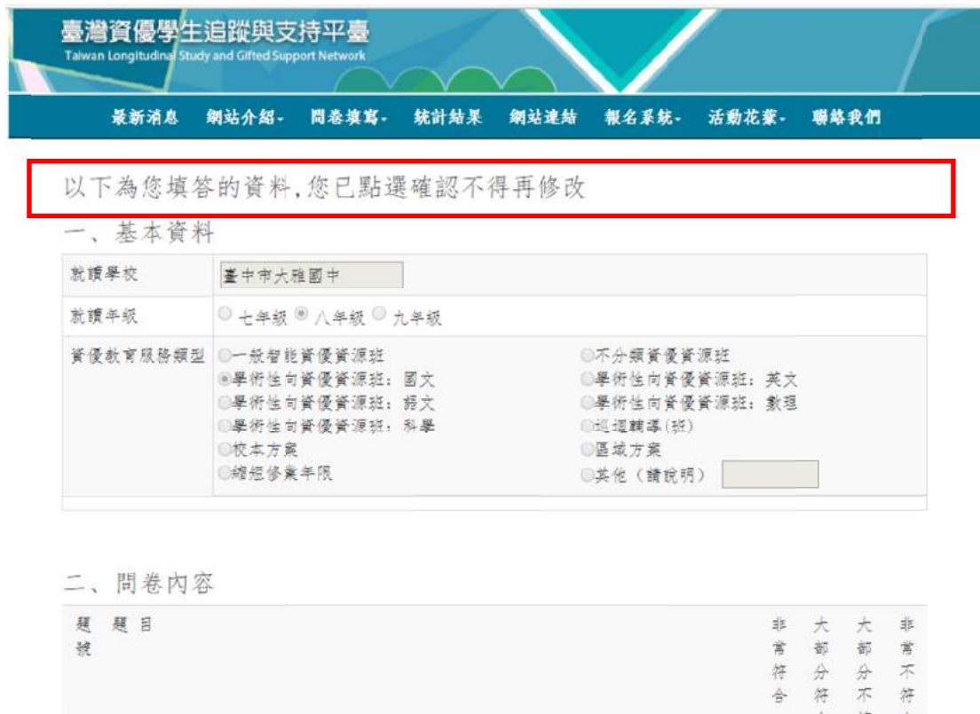
圖 25 問卷填答完畢不得再修改頁面

14. 問卷填答完畢不得再修改：學生若問卷填寫並送出後，將不得再修改，如圖 25 所示。