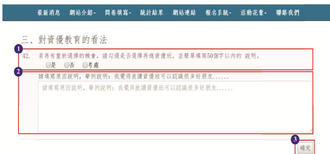
圖 18 對資優教育的看法簡答題