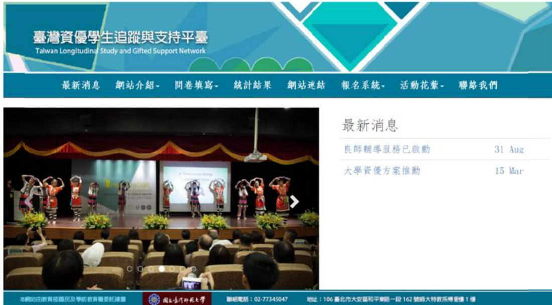
圖 1 臺灣資優學生追蹤與支持平臺