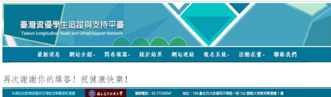
圖 24 問卷完成頁面

13. 問卷完成頁面：出現 再次謝謝你的填答！祝健康快樂！ 即完成問卷填答，如圖 24 所示。