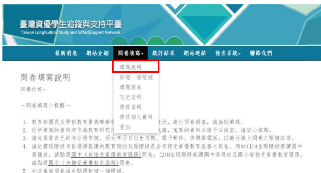
圖 3 填寫說明