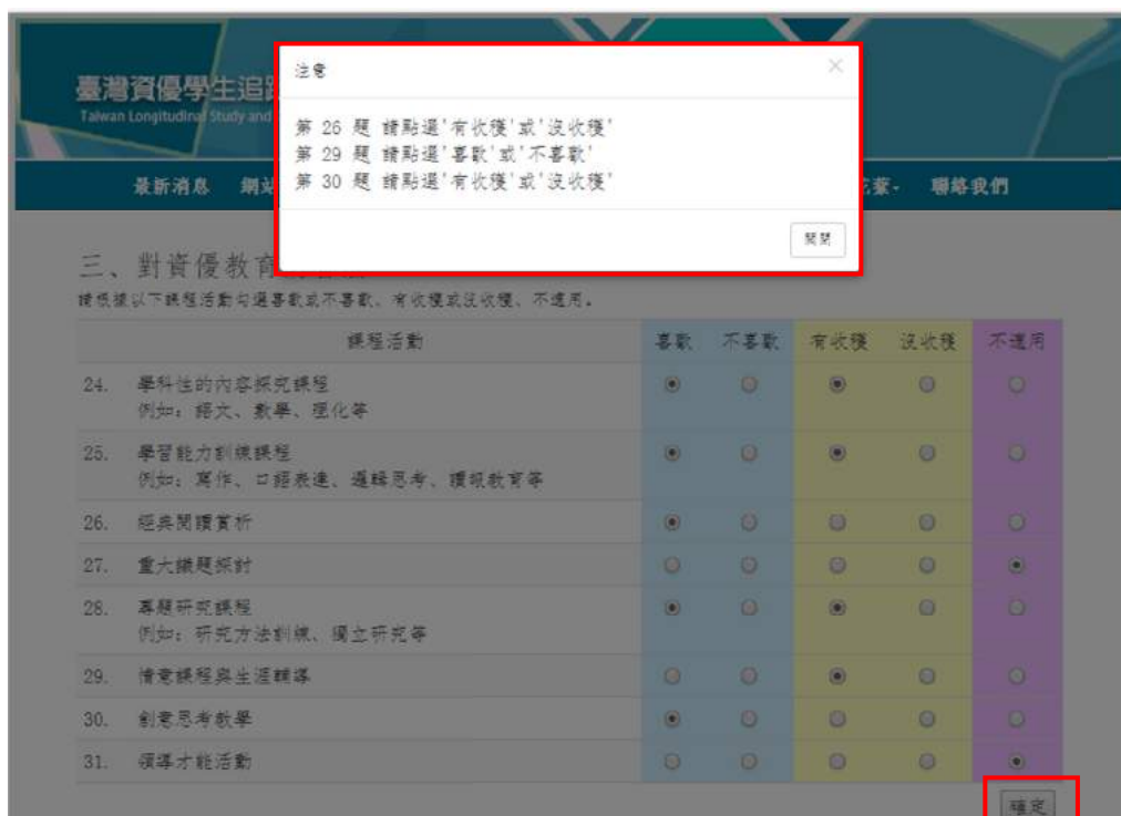
圖 15 課程活動作答不完整