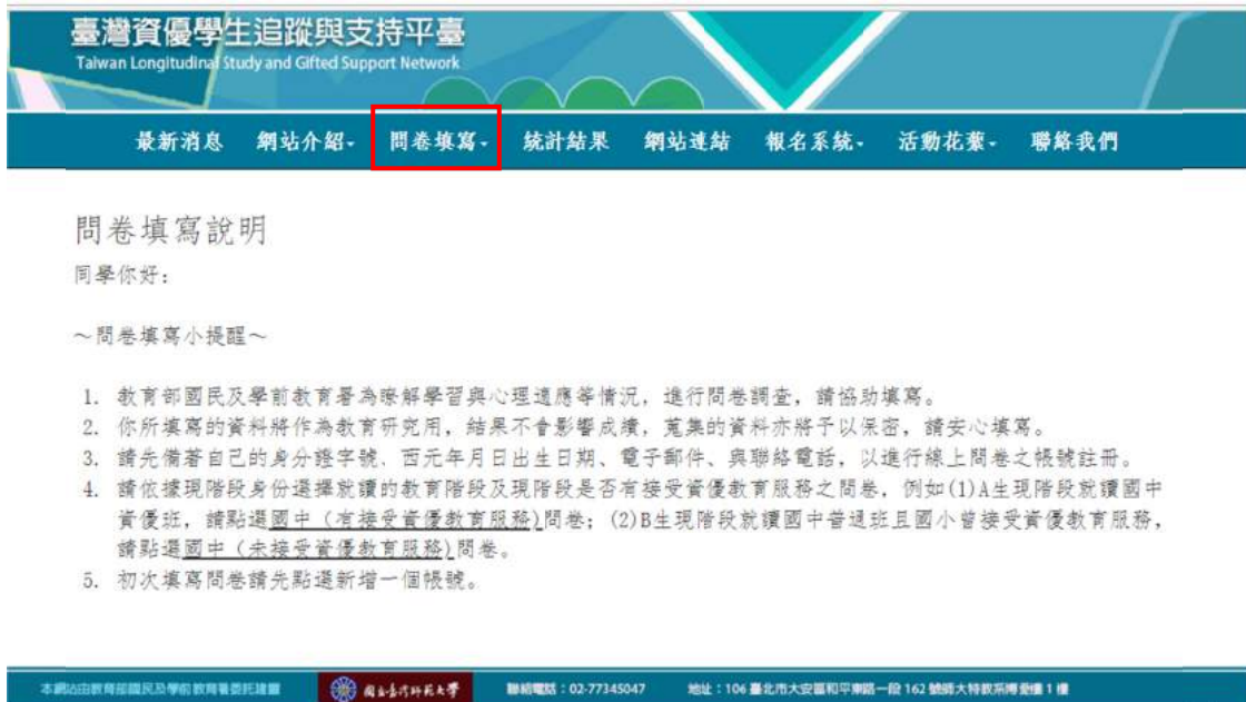
圖 2 問卷填寫